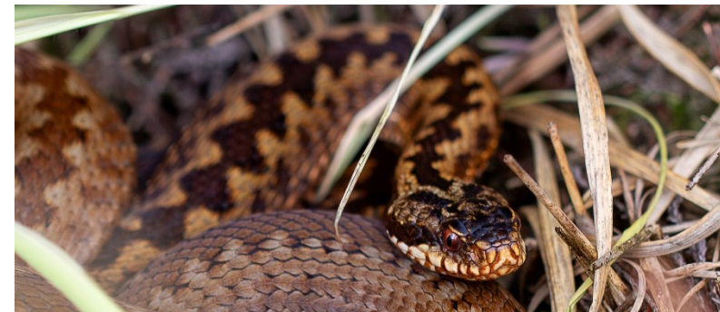
Kreuzotter im Loyer Moor

So., 5. Mai, Entdeckungstour durch das Loyer Moor