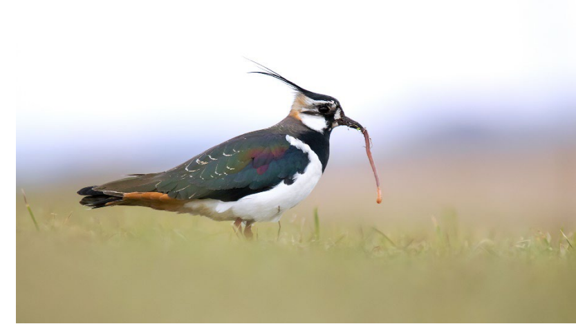
Vogel des Jahres 2024: Kiebitz