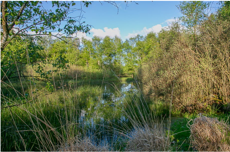
Gewässerlandschaft der Gellener Torfmöörte