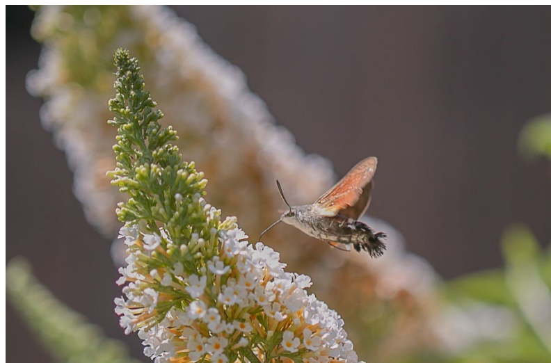
Taubenschwänzchen im Loyer Moor

Treffpunkt: Birkenstr. 33 im Loyer Moor, 10:00 Uhr