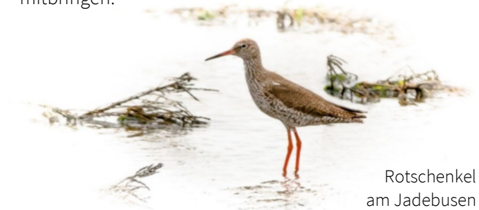
Rotschenkel am Jadebusen

Ornithologisch wie floristisch hochinteressanter Ausflug an den südlichen Jadebusen. Neben der Erkundung dieses weltweit einmaligen Biotops bestehen hier Beobachtungsmöglichkeiten für die auf das Wattenmeer spezialisierten Wat- und Wasservögel. Ferngläser bitte mitbringen.