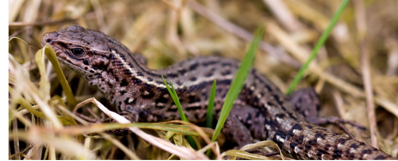
Waldeidechse im Loyer Moor