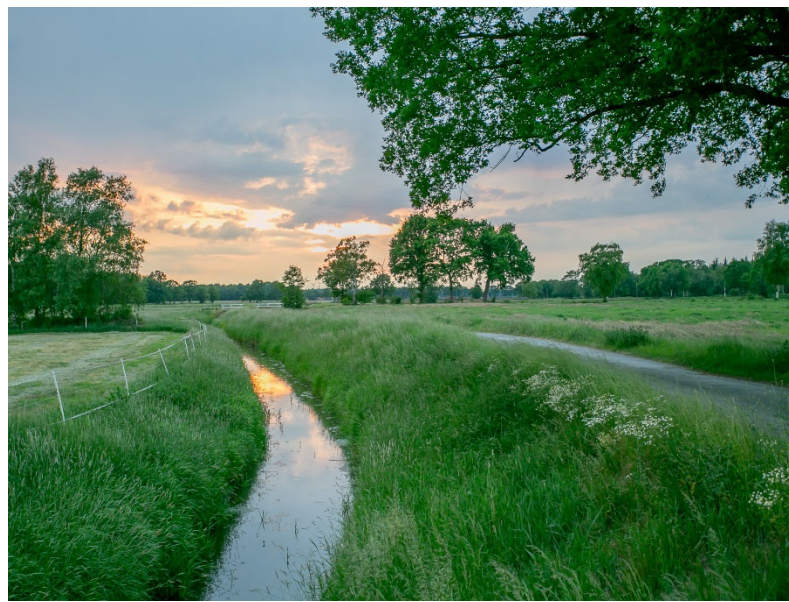
Hankhäuser Moor - Geestrandtief